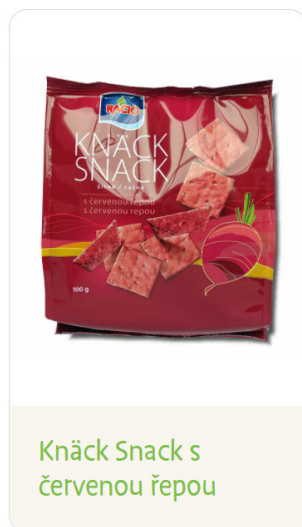
Knäck Snack s červenou řepou

antiseptické účinky, podporuje imunitu, posiluje játra a žaludek a zrychluje metabolismus.