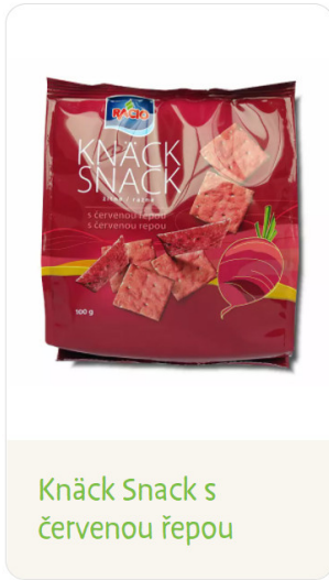
Knäck Snack s červenou řepou