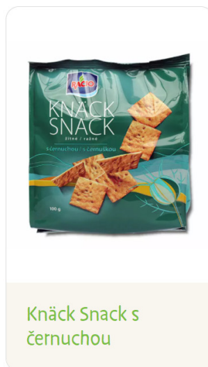
Knäck Snack s černuchou